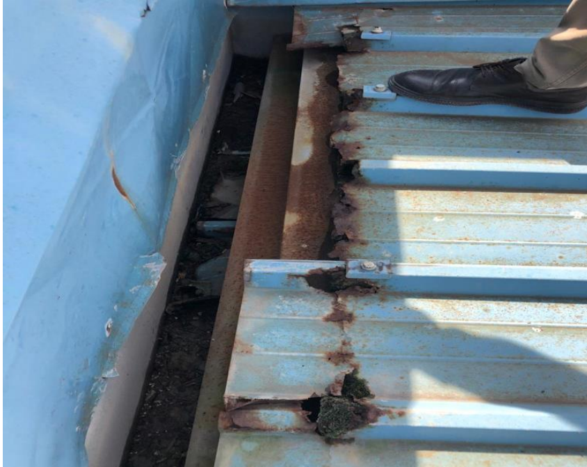
Pamje nga çatia tek salla magazine oficine