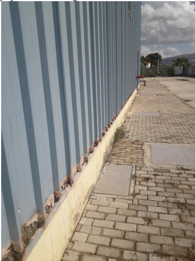
Pamje e brezit fundor te objekteve